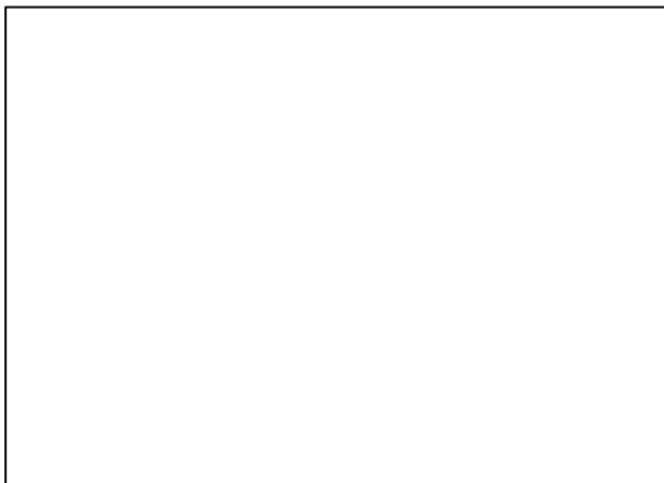
就任の挨拶をする 新会長

新会長はあいさつの中で、「改めて果たすべき責任の重さを感じ、身の引き締まる思いです。136年目を迎えた歴史ある安曇野市教育会の長い歴史と伝統の上に立ちながら、これからの時代に即した変革を模索していくことが大切であると考えます。人と人とのつながりを大切にしながら、支え育む安曇野の子ども達のために先生方と一緒に一歩ずつ歩んでいきます。」と抱負を述べられました。